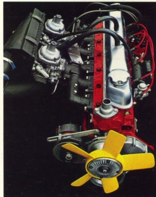
B 30. 3 liters, 6-cylindrig. 145 hk SAE. Avgasrening som standard.