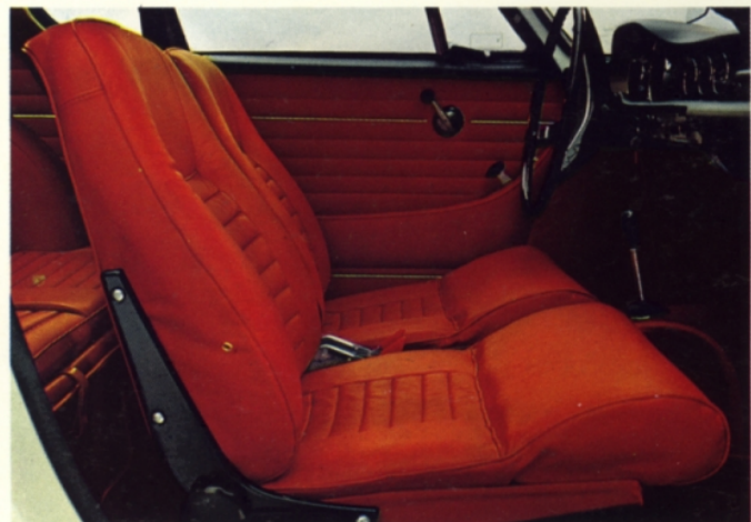
Volvo 1800 S