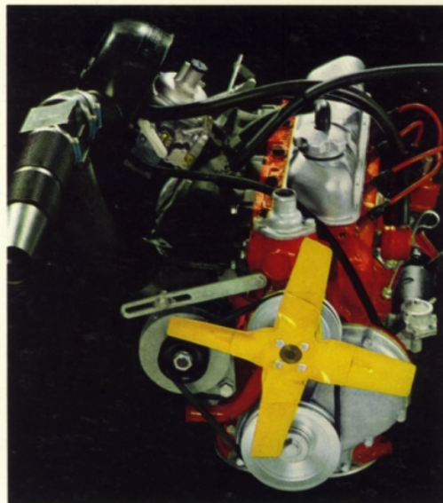
B 20 A. 2 liters, 4-cylindrig. 90 hk SAE. Avgasrening som standard.

Volvos kvalitet och slitstyrka bidrar till låga bilkostnader och högt andrahandsvärde. Dessutom har Volvo 164, 140-serien och Amazonmodellerna Volvos 5-åriga PV-garanti — ingen extra kostnad för vagnskadeförsäkring. Alla Volvo-ägare har dessutom tillgång till speciella försäkringsförmåner genom Volvia, Volvos eget försäkringsbolag.