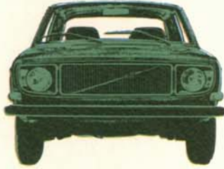
Volvo 144 de Luxe 4-dörrars, 90 eller 110 hk SAE