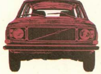
Volvo 145 de Luxe 5-dörrars, 110 hk SAE