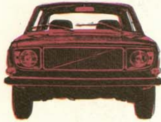
Volvo 142 de Luxe 2-dörrars, 90 eller 110 hk SAE