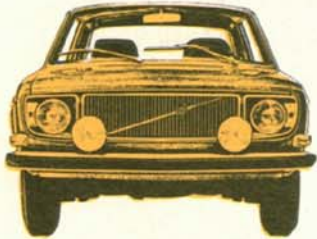
Volvo 142 Grand Luxe 2-dörrars, 135 hk SAE, elektronikstyrd bränsleinsprutning