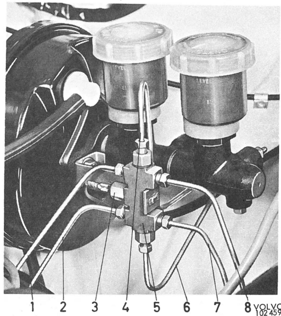
Fig. 3. (L.R. - besturing)