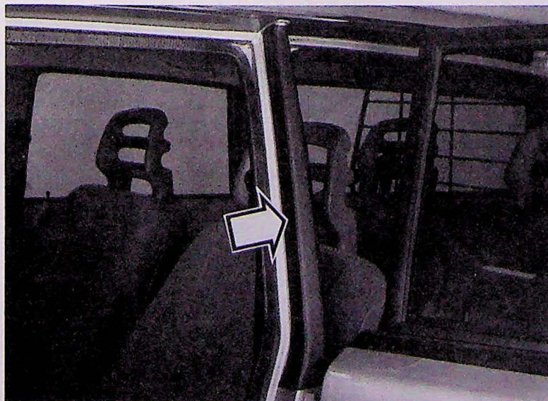
Band op B-stijl

Wanneer de band correct gepositioneerd is, moeten het water en de luchtbelletjes worden weggedrukt met een rubber spatel tot de band volledig vlakgestreken is.