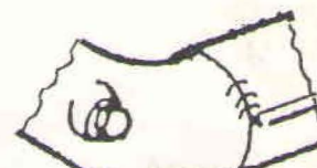
Oud (20 mm)