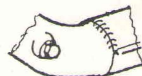
nieuw (50 mm)