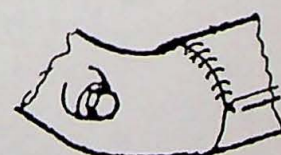
nieuw (50 mm)