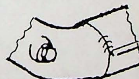
Oud (20 mm)