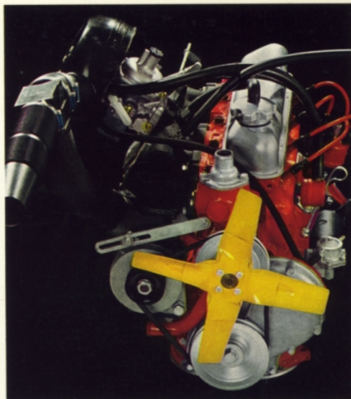
B 20 A. 2 liters, 4-cylindrig. 90 hk SAE. Avgasrening som standard.

Volvos kvalitet och slitstyrka bidrar till låga bilkostnader och högt andrahandsvärde. Dessutom har Volvo 164, 140-serien och Amazonmodellerna Volvos 5-åriga PV-garanti — ingen extra kostnad för vagnskadeförsäkring. Alla Volvo-ägare har dessutom tillgång till speciella försäkringsförmåner genom Volvia, Volvos eget försäkringsbolag.