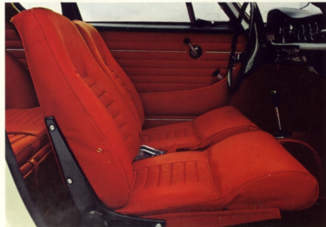
Volvo 1800 S