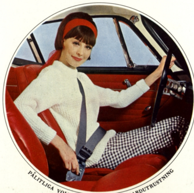
PÅLITLIGA VOLVO-BÄLTEN ÄR STANDARDUTRUSTNING