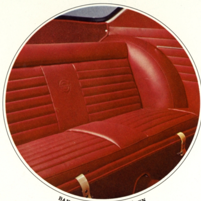
BAK FINNS TVÅ EXTRASÄTEN

På långfärd uppskattar man den ombonade interiören med de bekväma, ha- den rikhaltiga komfort- och säkerhetsutrustningen. Genomtänkt disponering mycket god plats för bagage, gör Volvo 1800 S idealisk för långa kontinentres