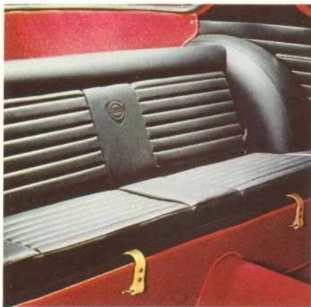
Achter zijn twee extra zittingen. Met neergeklapte achterleuning wordt er ruimte voor bagage gemaakt.