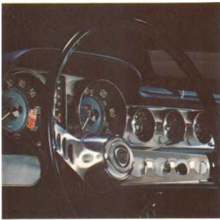
Het instrumentenpaneel is volledig

"Een prettige wagen voor mensen, die zich snel en geriefelijk willen verplaatsen." (Road & Track)