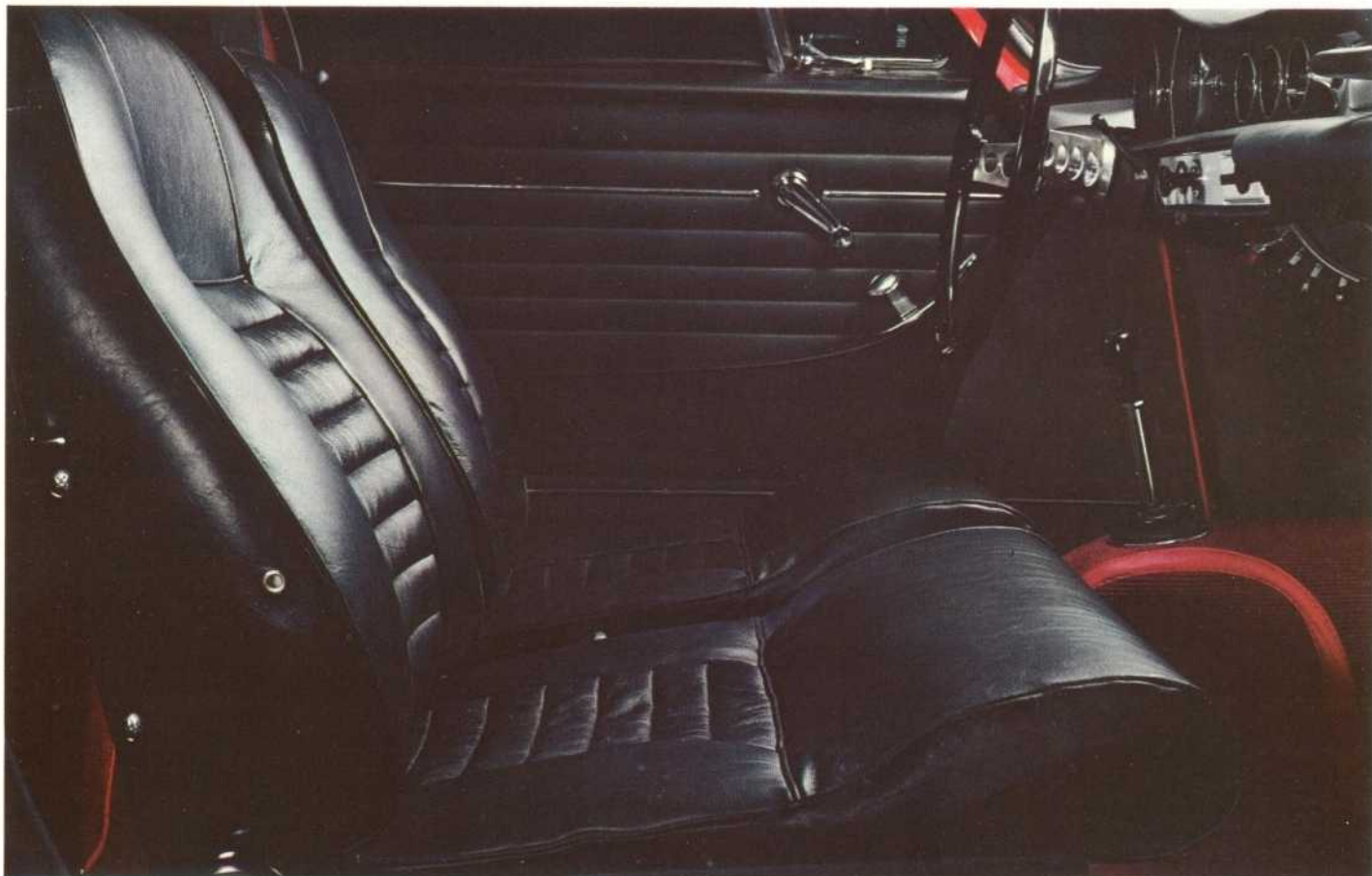
Geriefelijke, met leer beklede stoelen. Geheel verstelbaar. Ook de stand van het lendensteuntje kan veranderd worden.