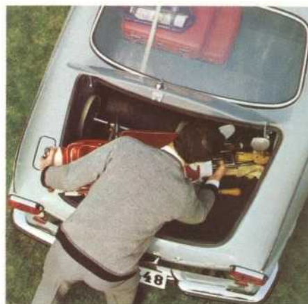
Een voor dit type wagen ongewoon grote bagageruimte.