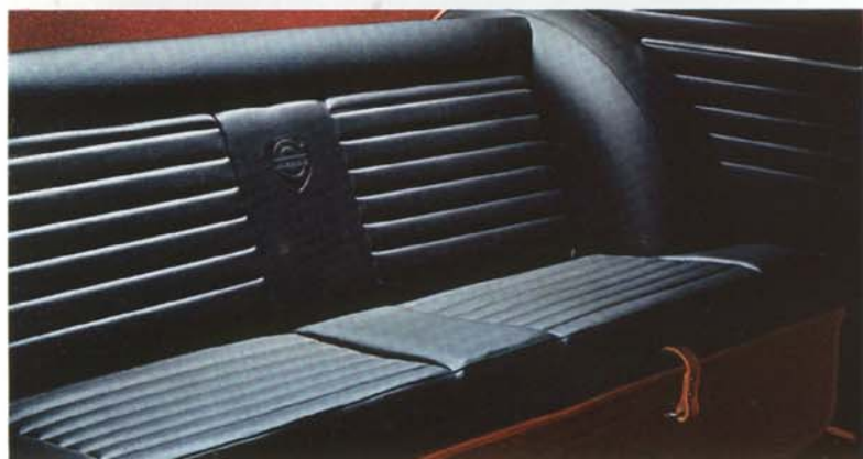
Bakom stolarna finns extra sittplats.

Det är lätt att hantera en 1800 S. Manöverorganen är riktigt utformade och väl-placerade. Pedalerna är lätta att nå. En platt att vila kopplingsfoten på är en plusdetalj. Avståndet mellan ratten och den korta, stadiga växelspaken är litet. Den sobert utformade instrumentbrädan har alla de instrument som en sportvagnsförare behöver för snabb och god kontroll över bilens alla funktioner.