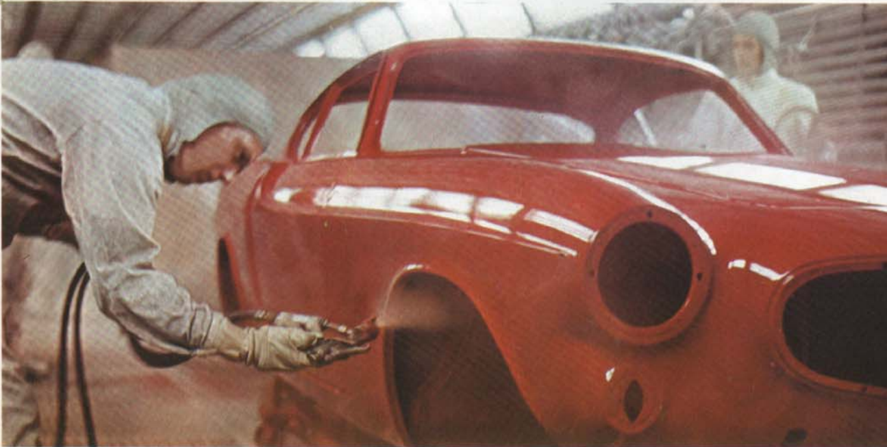
Forstklassig lackering – forstklassigt rostskydd.