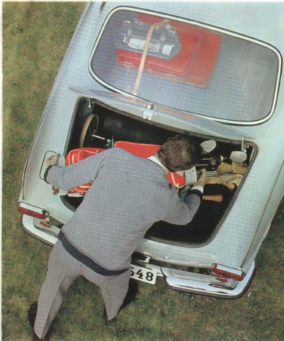
Gott om plats för långfärdsbagage.

”Långfärdströtthet hör inte till bilden. Detta är en vagn man kan köra över 1.000 km i sträck utan att komma fram med huvudbladen, heshet eller andra trötthetssymptom, vilka brukar förekomma med långfärder i mindre lyckade vagnar.” (Sports Car Graphic)