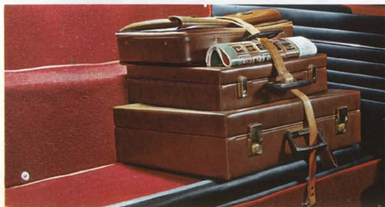
Nedfällt blir extrasätet en rymlig plattform för bagage.