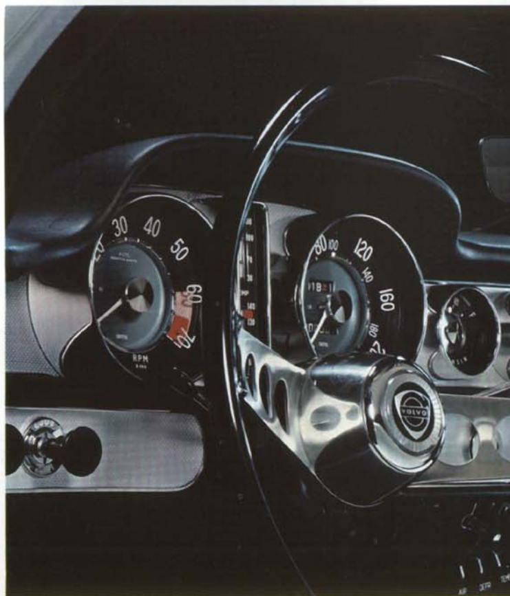
Rikhaltig instrumentering, översködligt arrangerad.