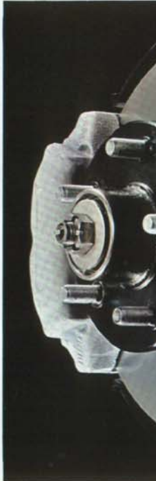
115 hk SAE. Snabb och varvillig. Robust och ekonomisk.