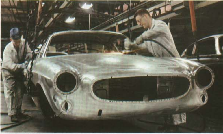
Självbärande kaross – vridstyv enhet för enastående vagegenskaper och god säkerhet.

”Vagnens smidiga prestanda återspeglas i karossens mjukt strömlinjeformade linjer.” (Car & Driver)