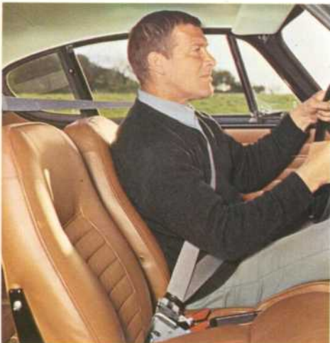
Correa de seguridad tipo 3 puntos como standard