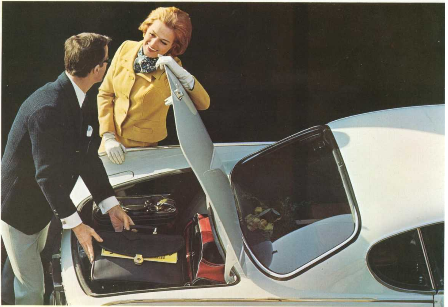
Un amplio baúl para este tipo de coche