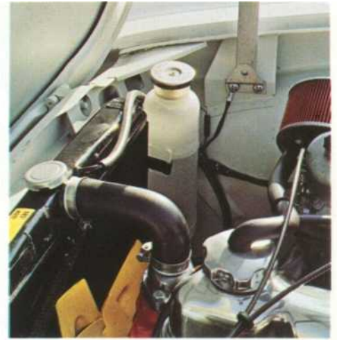
Sistema de refrigeración de circuito cerrado