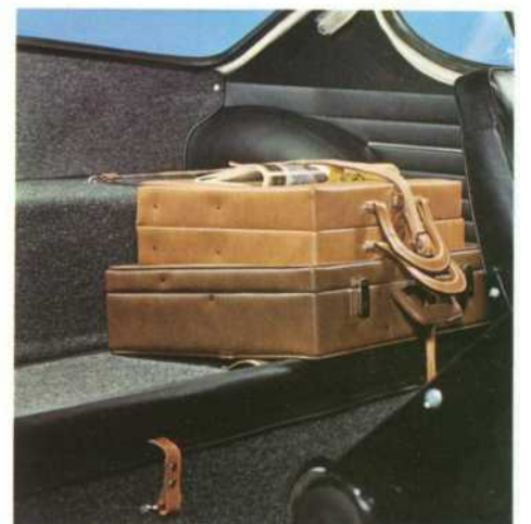
El respaldo plegado significa buen lugar para equipajes