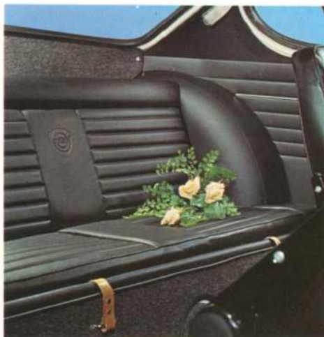
Atrás existen dos asientos extras