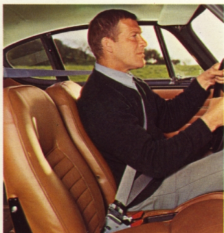
3-punkts säkerhetsbälten är standard