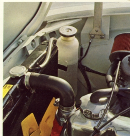
Slutet kylsystem, fryssäkert ner till -40°