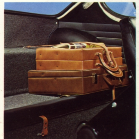
Nedfällt ryggstöd ger bagageplats