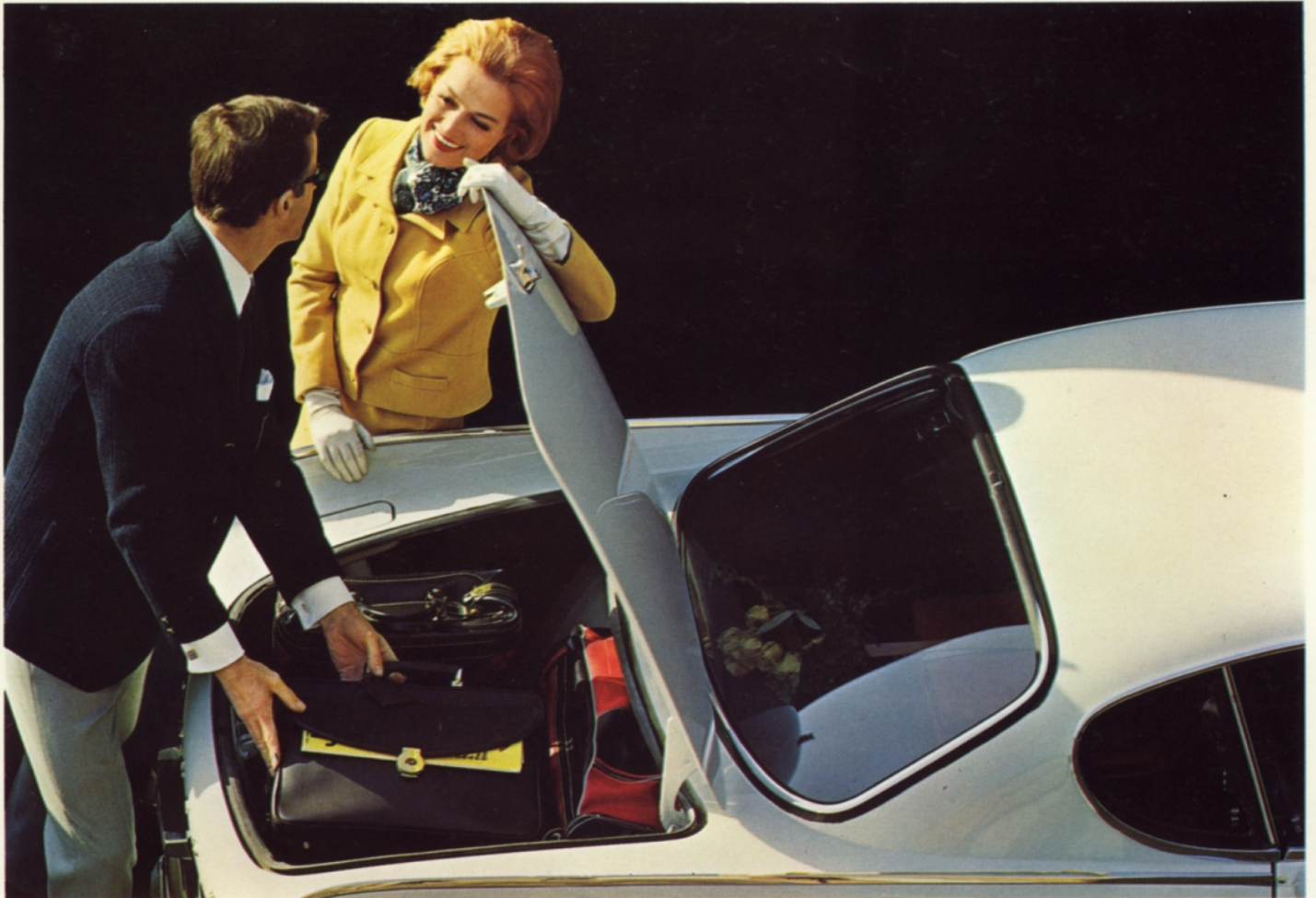
Ett för vagn typen stort bagagerum